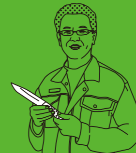
ISHIKAWA HAMONO SEISAKU SHO TYPE: KNIFE