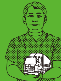
NOHI SEINO UNYU TYPE: LOGISTICS