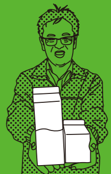
SEKI GYUNYU TYPE: MILK