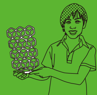
SUGIYAMA SEISAKU SHO TYPE: IRON GOODS