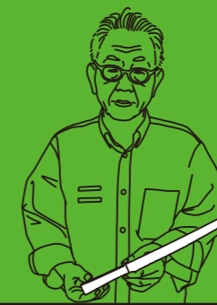
SHIZU HAMONO SEISAKU SHO TYPE: KITCHEN KNIFE