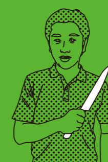
MARUSHO KOGYO TYPE: KITCHEN KNIFE