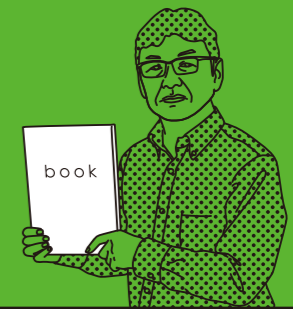
KYODO INSATSU TYPE: PRINTING