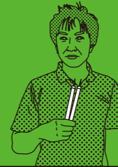
YOSHIHARU HAMONO TYPE: CARVING KNIFE