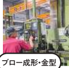
ブロー成形・金型